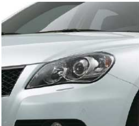
Snow White Pearl Metallic (ZMT)