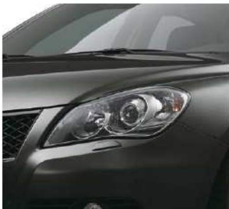
Super Black Pearl Metallic (ZMV)