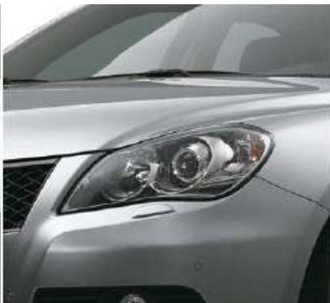
Premium Silver Metallic (ZNC)