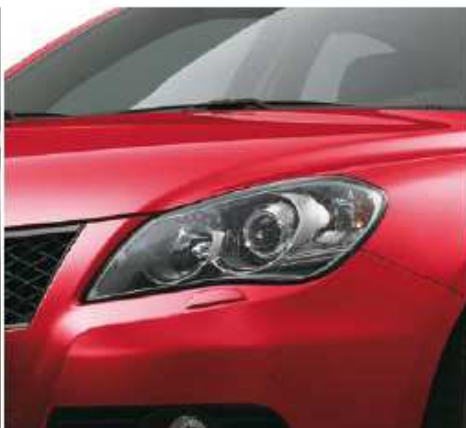
Fervant Red (ZNB)