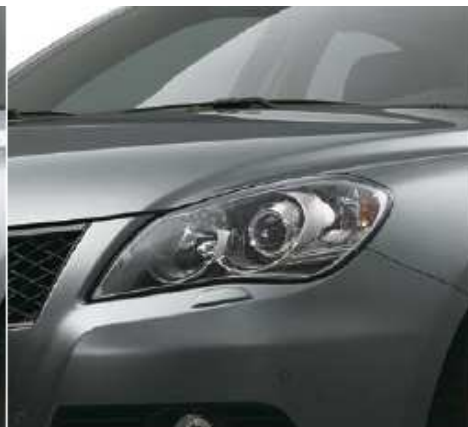
Mineral Gray Metallic (ZMW)